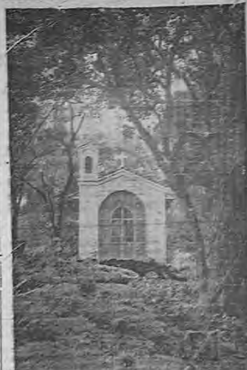
"El Huerto de Getsemani", en Rio Segundo de San Rafael de Heredia, que será bendecido el domingo próximo. El acto, que ha sido cuidadosamente preparado, revestirá, no dudamos, especial solemnidad

Grandes preparativos se han hecho para el acto, que tendrá lugar el domingo próximo