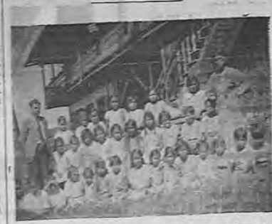
Una de las secciones de la escuela de Pavas de Turrialba, que reciben sus lecciones en una casa particular, la que no podrá continuar facilitando su propietario durante el año venidero. Los niños, en consecuencia, quedarán sin recibir sus clases de no procederse a la construcción del edificio escolar.

Sólo se da clases actualmente a cincuenta alumnos, habiendo en esta escuela un centenar